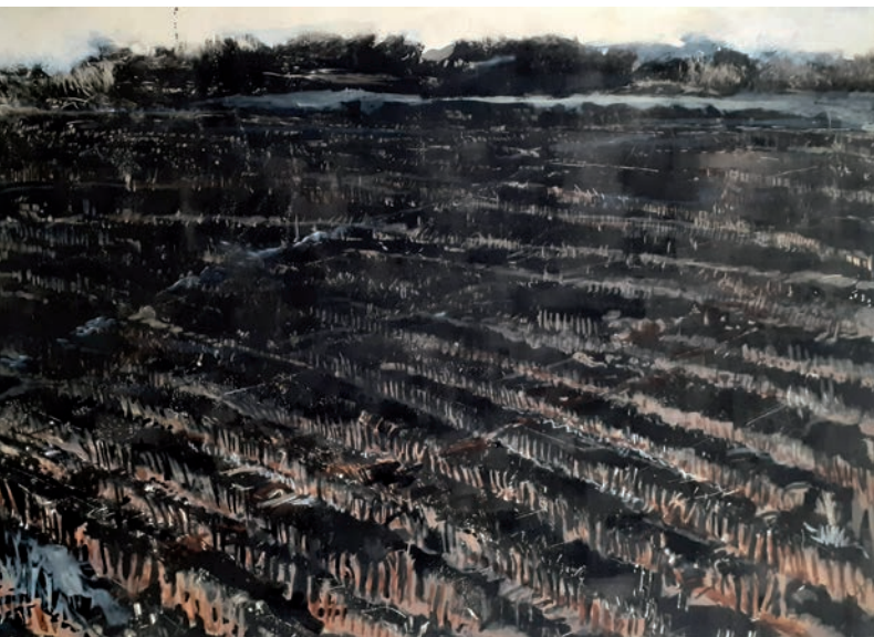
Abb.: Andreas Grellmann Agrarlandschaft. 2016 Monotypie + Aquarell