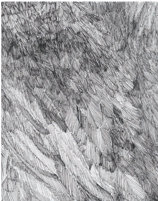
Abb.: Ausschnitt Bettina Paschke Blue Days (Nr.120) Tusche auf Papier, 2019 20x30 cm

Titel: Detail Lotte Buch Ortswechsel Steinzeug, Porzellan, 2016 125x65x43 cm/24x52x36 cm