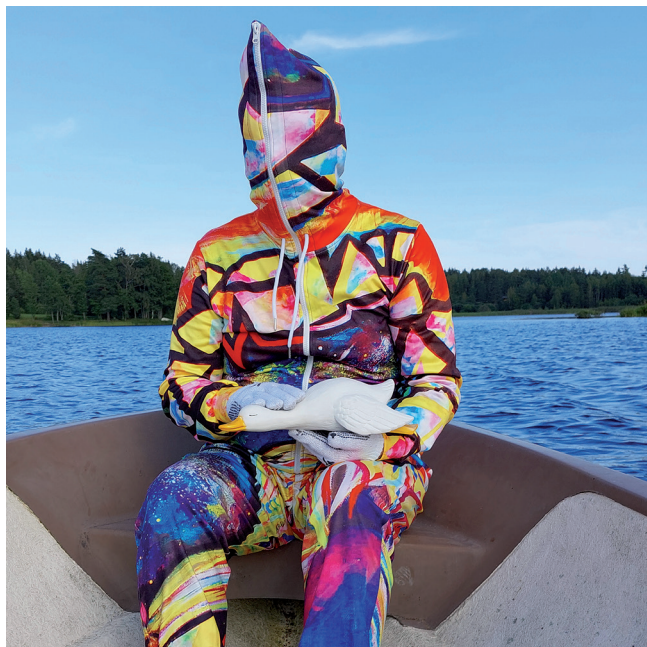
Abb.: Forschungsgruppe Kunst Sommerfrische mit Ernst. Digitaldruck auf Aluminium 20 x 20 cm 2021

Titel: (Ausschnitt) Felix Fugenzahn Nanu? Siebdruck auf Papier 60 x 50 cm 2021