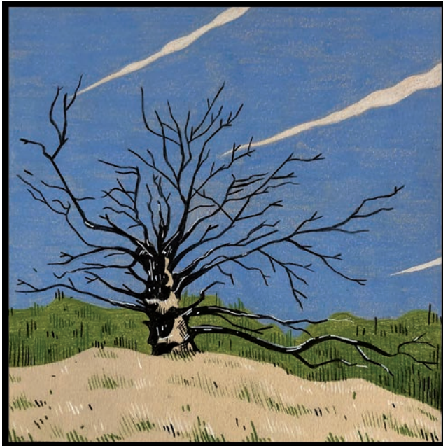
Abb.: Christoph Knitter Tales of Terror Pt. 8. Buntstift auf Papier 2023