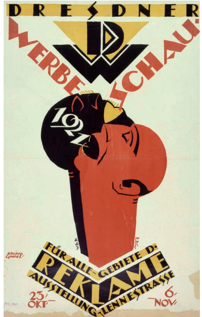
Abb.: Bruno Gimpel Dresdner Werbeschau. Plakat, 1921