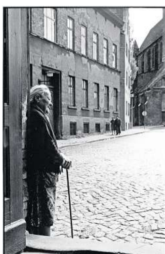
Zu sehen ist auch der Silbergelatineabzug von Gerhard Weber.