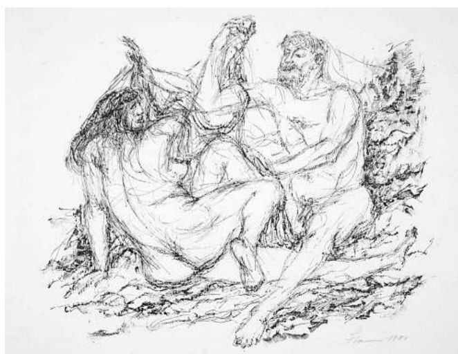
In der aktuellen Ausstellung wird die Lithografie von Fritz Cremer „Liebespaar“ gezeigt.

Info Aktuelle Ausstellung: „30 263 763 JUBILÄUM“, zu sehen bis 15. Januar 2023 im Kunstverein zu Rostock (Amberg 13, 18055 Rostock), geöffnet dienstags bis sonntags von 14 bis 18 Uhr (außer am 31. Dezember und am 1. Januar), Eintritt frei.