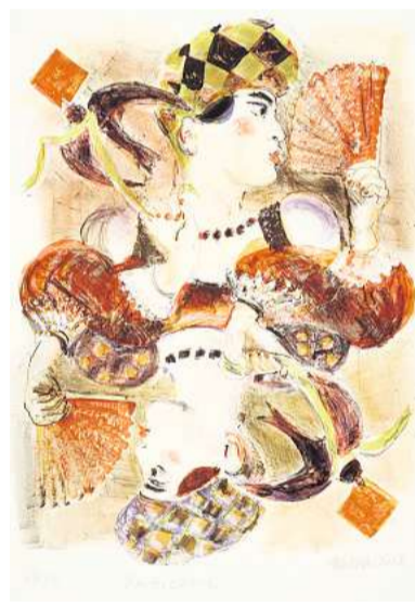
Auch Harald Metzkes Farblithografie „Karo Dame“ ist Bestandteil der Sammlung des Vereins.

Die Ausstellungen finden (bis auf die OZ-Kunsthörse) in den Räumen des Kunstvereins zu Rostock statt.