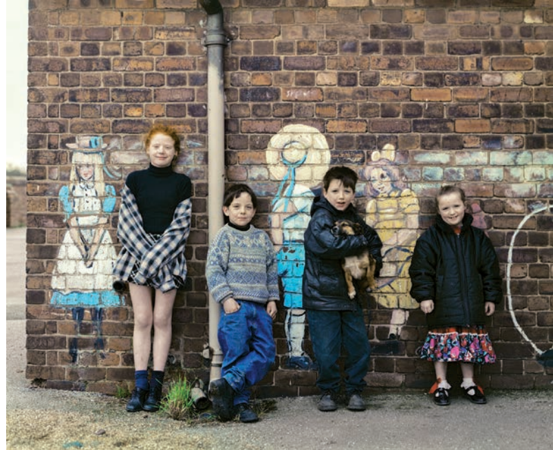
Abb. Titelseite: Gerhard Stromberg „Schulkinder (Arkwright I)“ 1996/2016